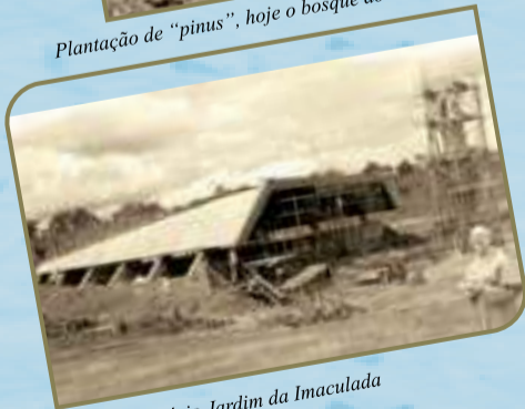
Capela-Santuário Jardim da Imaculada na fase inicial de construção.