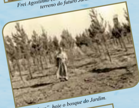
Plantação de “pinus”, hoje o bosque do Jardim.