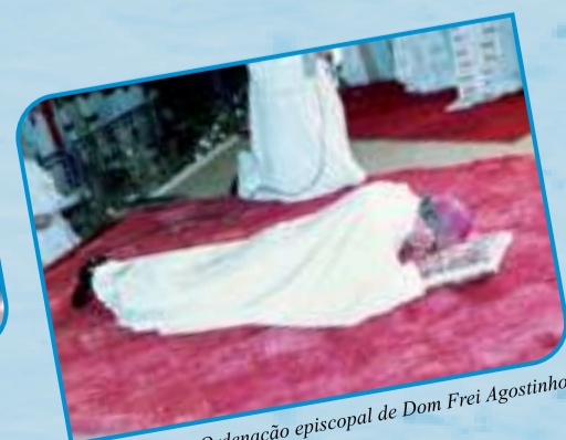
Ordenação episcopal de Dom Frei Agostinho