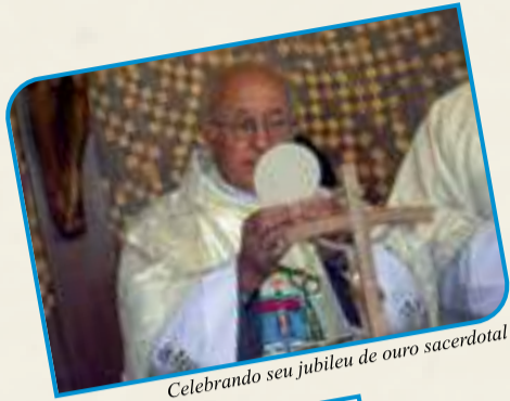
Celebrando seu jubileu de ouro sacerdotal

logo depois, se Deus quiser, espero voltar, espiritualmente reabastecido, para minha querida Amazônia. Enquanto isso, recebam minhas bênçãos jubilares."