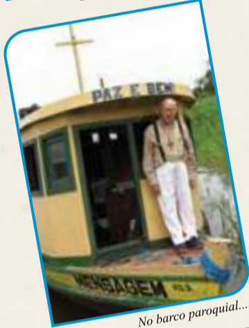
No barco paroquial...