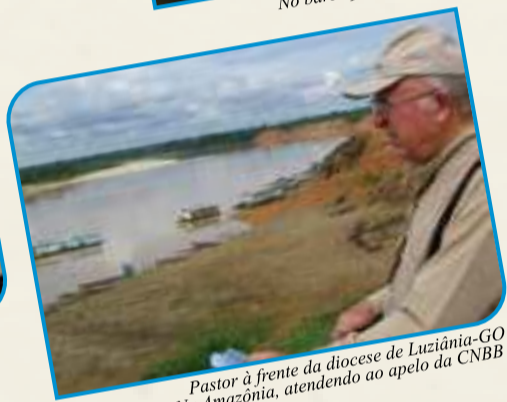
Pastor à frente da diocese de Luziânia-GO Na Amazônia, atendendo ao apelo da CNBB