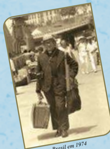
Chegada no Brasil em 1974

Ele foi agricultor, mecânico, trabalhou forçado para o exercito nazista, frade, sacerdote, doutor em teologia, mestre de noviços, formador, escritor, tradutor, grafico, pedreiro, pintor, barqueiro, catequistas, missionário, confessor, bispo, frade franciscano e principalmete um grande devoto de Nossa Senhora.